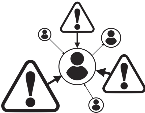
Joonis I.1. Liigsele egotsentrilisusele üles ehitatud sotsiaalvõrgustik

Täiskasvanuea saabudes lasub meie turjal lapsepõlvega võrreldes oluliselt rohkem muresid ja kohustusi. Nii on oma enesekeskse universumi lõksu jäädes – ja seda tuleb ette sageli – lihtne keskenduda üksnes omaenese probleemidele ja tekib oht asju üle võlli ajada. Vaadelgem õige oma ego suhete, meie ees olevate probleemide ja arvamuste vahetamise kaudu. (Joonis I.1)